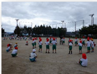
1・2年生、3・4年生、5・6年生の練習の様子

運動会に向けて、各種目の練習をがんばっています。また、6年生を中心に運動会を盛り上げるためのいろいろな準備に取り組んでいます!