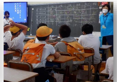
6年生運動会スタッフ会議の様子